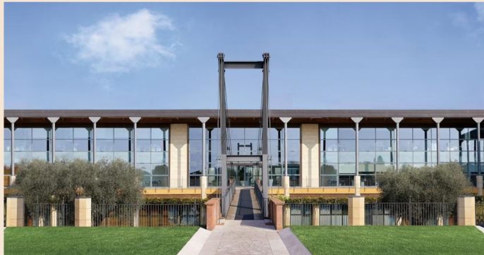
▲ La sede del gruppo Oniverse (ex Calzedonia) a Villafranca di Verona