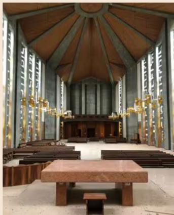
▲ L'interno della chiesa di San Giuseppe nell'ex-Seminario di San Massimo a Verona

Tornando al concorso di idee lanciato per riqualificare l'ex seminario di Verona, il progetto offre a individui, imprese e consorzi, enti pubblici e privati, associazioni, come università, istituti di formazione e ricerca fino agli istituti scolastici la possibilità di ripensare l'area di ben 17 ettari, e offrire un futuro a edifici e spazi come il teatro-auditorium da 700 posti