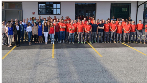
Il gruppo lavoratori della Ard Raccanello

Publicata la classifica dedicata ai "Blue Collar" che premia le migliori aziende in cui si lavora bene secondo il parere degli operai